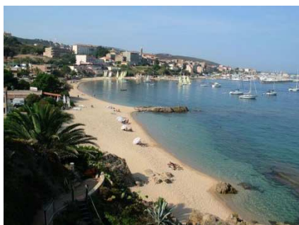
plage de Mancinu

L'abondance culturelle des régions pétrées de tradition et un site d'exception pour des loisirs toniques.